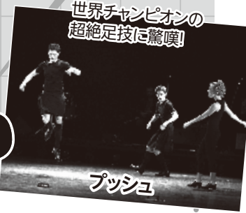
世界チャンピオンの超絶足技に驚嘆!

伝統的なダンス。息をつかせぬ超絶技巧の連続。芸術監督マーク・ハワードの新作も発表!!