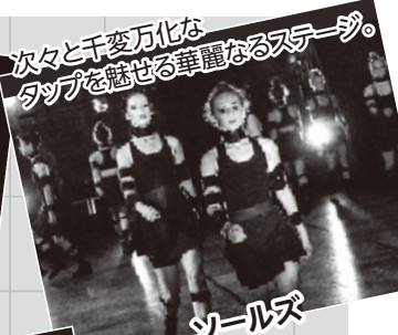
次々と千変万化なタップを魅せる華麗なるステージ。