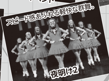
スピード感あふれる軽快な群舞。