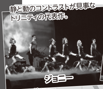
静と動のコントラストが見事なトリニティの代表作。

2 004年以来7度目となる今回の日本ツアーでは、2014年の世界チャンピオン、アリー・ダウティが女性としては初のプリンシパル・ダンサーとして参加。マーク・ハワードの新作も加わるなど話題豊富。アイリッシュ・アメリカンの聖地シカゴから、今年もタップの嵐が吹き荒れる!