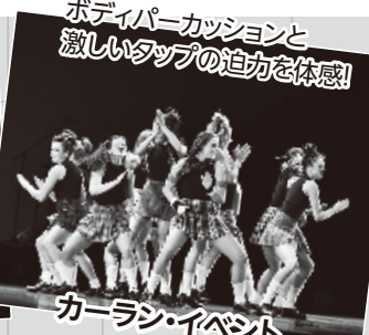
ボディパーカッションと激しいタップの迫力を体感!