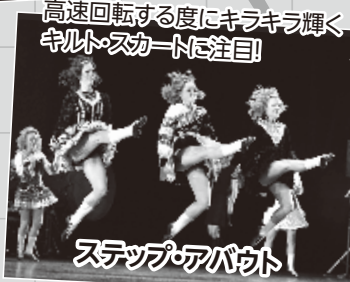
高速回転する度にキラキラ輝くキルト・スカートに注目!