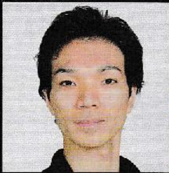
「子供の情景」 振付 小林洋彦