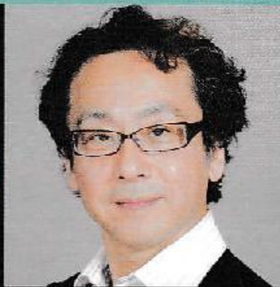
「終息への扉」 振付 中島伸欣