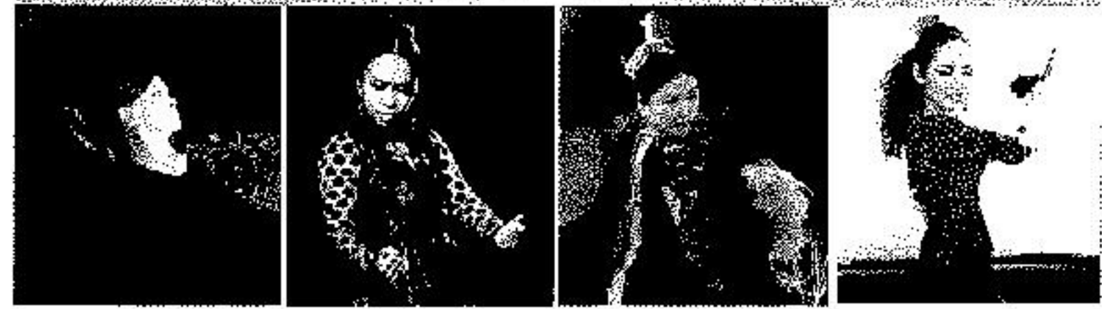
小島葉子 太田マキ バイレフラメンコ エス・エスパニョール 大野環 前田いおり エス・エスパニョール スチゲル・ロト至