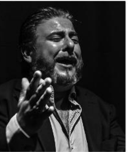
エル・プラテアオ EL PLATEAO 【カンテ】