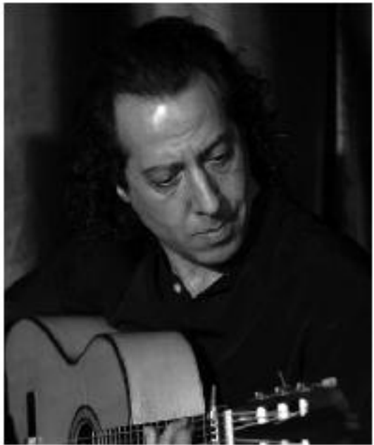
ペペ・マジヤ PEPE MAYA 【ギター】