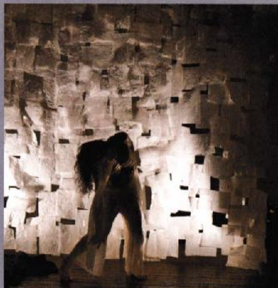
写真：表面=「夜」(2017)より、裏面=「失われた地へ」(2015)より