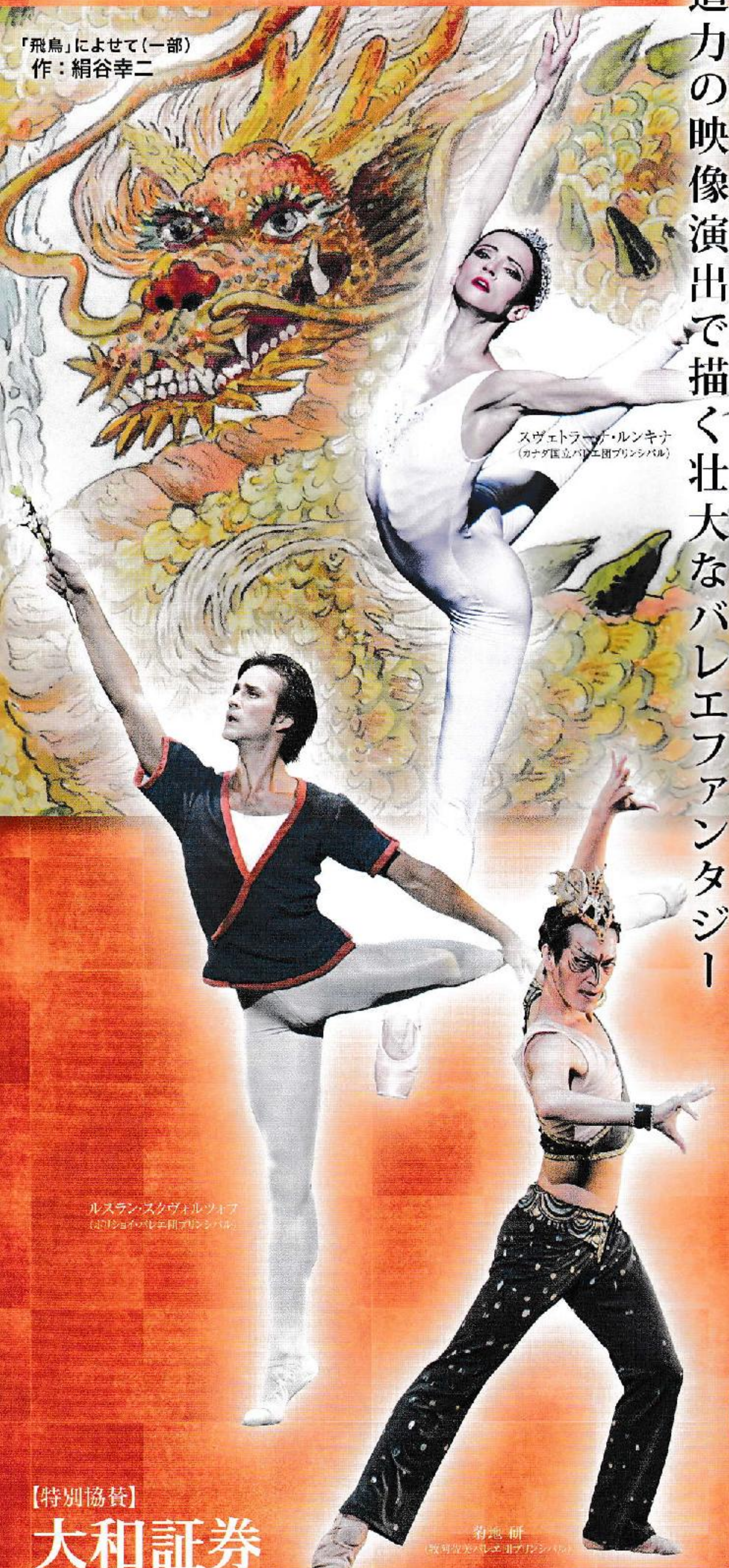
スヴェトラナ・ルンキナ (カナダ国立バレエ団プリンシパル)