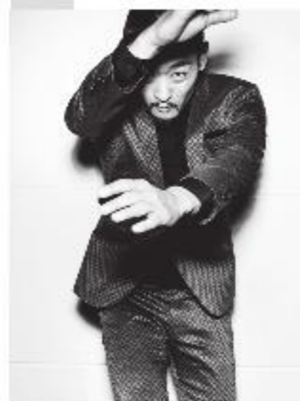
島地保武 | Yasutake Shimaji