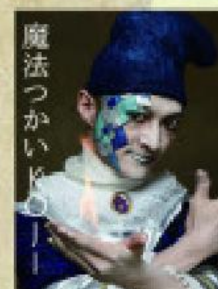
魔法つかいドリー