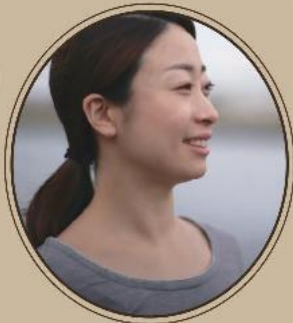
菅野美亜 / コンテンポラリーダンス