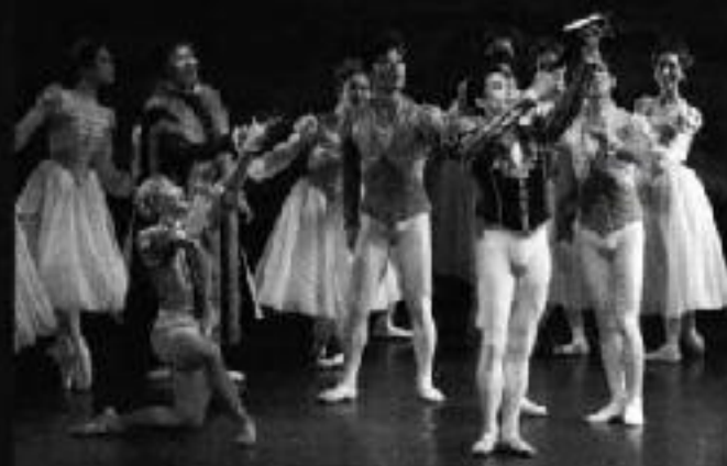
第1幕 王子の居城に近い狩場

湖のほとりで嘆き悲しむオデットに心から許しを乞う王子の思いが通じると、二人の愛は白鳥たちを奮い立たせる。すると、悪魔の魔力は解かれ、白鳥たちは人間に甦り、夜明けを迎える。