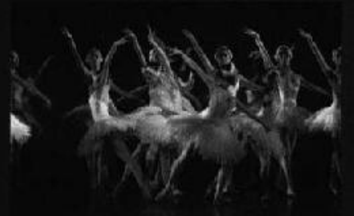
第4幕 再び森の嘆きの湖畔