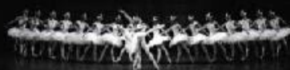
第2幕 森の奥、湖のほとり