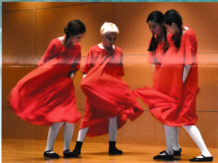
2016年7月「ダンスと言霊」より。