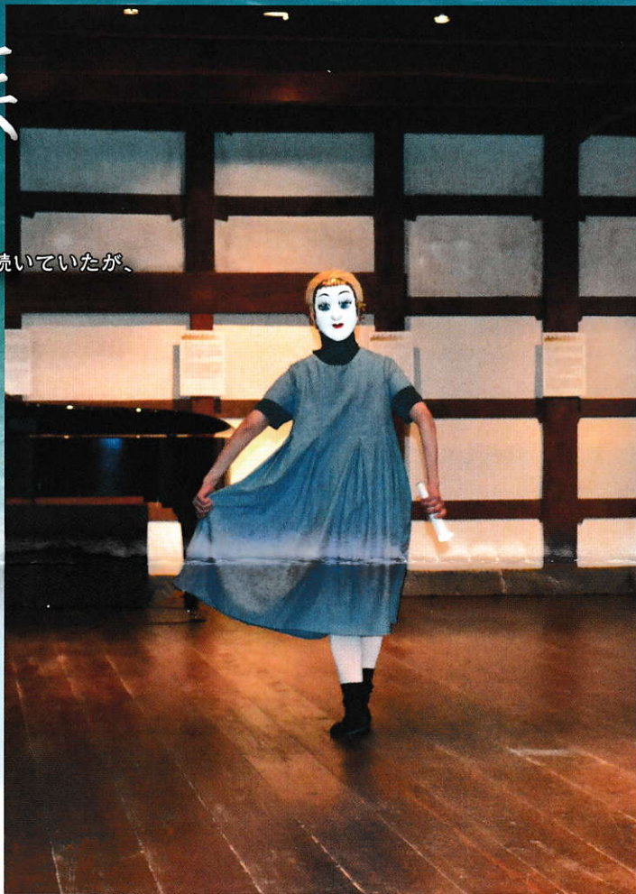
2015年10月「賢治の横顔」より。