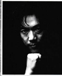
演出・振付 篠原 聖一