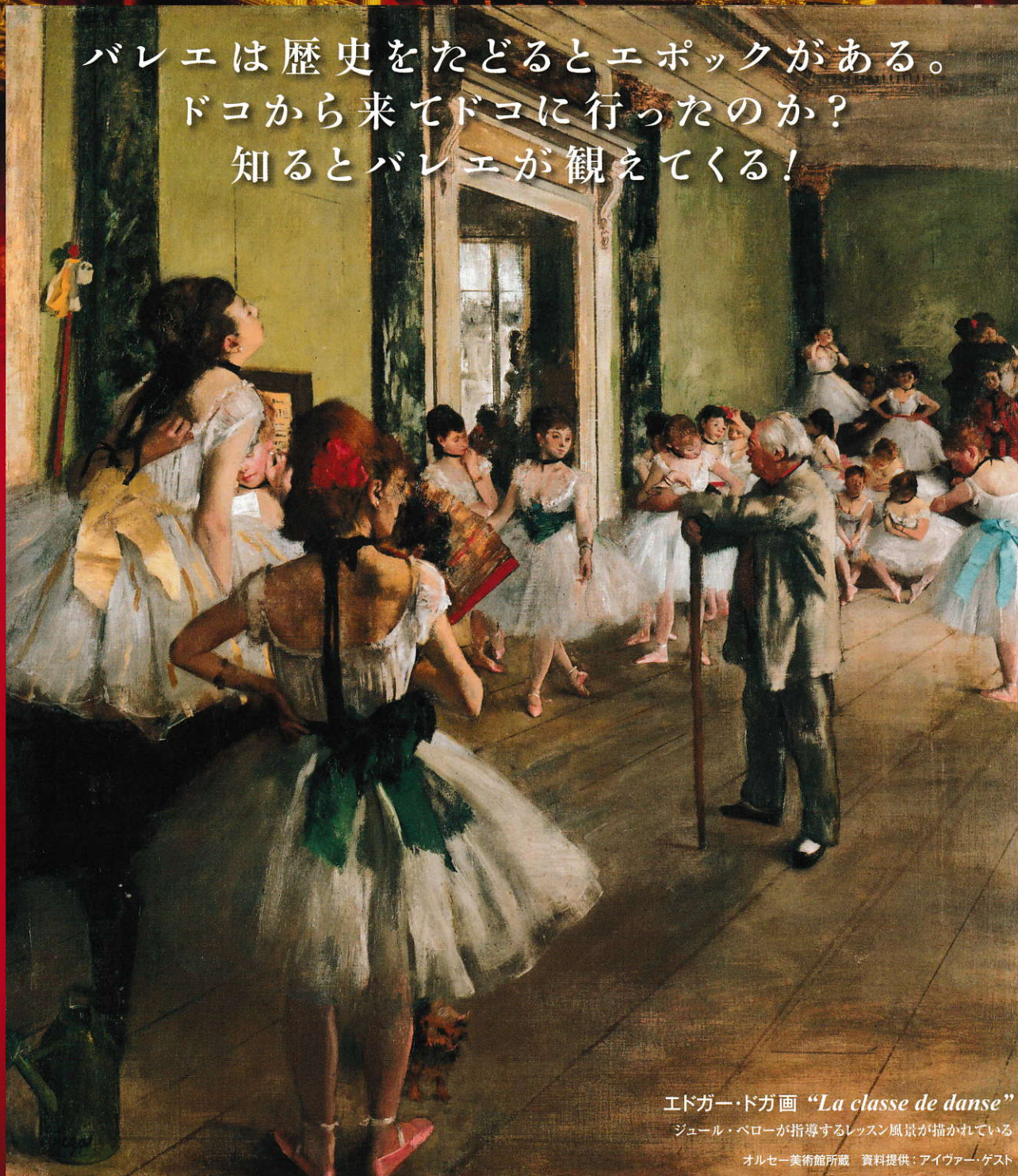
エドガー・ドガ画 “La classe de danse”

バレエは歴史をたどるとエポックがある。 ドコから来てドコに行ったのか? 知るとバレエが観えてくる!