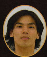
刑部星矢 Seiya Gyobu