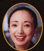
森下洋子 Yoko Morishita