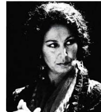
カンテ カルボネーラ Carbonera