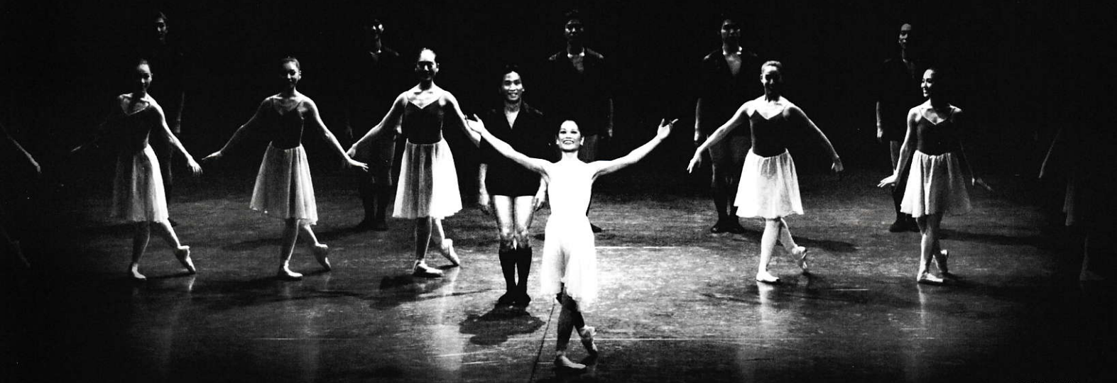
2013年の公演より