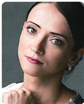
春日野すがるをとめ