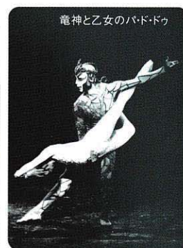
竜神と乙女のバド・ドゥ