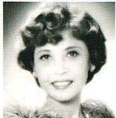
振付家 牧阿佐美 (まき あさみ)

奈良市生まれ。東京藝術大学絵画科油画卒業、同大学院を修了後のイタリア留学で古典技法アフレスコを習得。その技法を独自のものとしながら、画家自身にたぎるエネルギーを表出したかのような奔放かつ鮮烈な絵画表現。人物画でスタートしたその画業は、ヴェネツィア風景、富嶽などの多様な展開を見せながら、近年は古事記をはじめ日本の神話、信仰を背景とするドメスティックな精神世界を追求するなど、さらなる円熟の境地に達している。1997年、長野冬季五輪の公式ポスターを手掛ける。文化功労者、日本芸術院会員、独立美術協会会員、東京藝術大学名誉教授、大阪芸術大学教授。