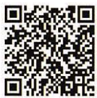
牧阿佐美バレエ団 オフィシャルチケット