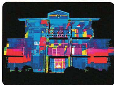
プロジェクションマッピング by ZERO-TEN

本作品の美術には、日本を代表する洋画家、絹谷幸二氏が本作の為に作品「飛鳥に寄せて」を制作しました。これを基にした映像演出によって創り上げる舞台空間は、ファンタジーの世界に繋がる壮大ないにしへの都。日本が誇るオペラ・バレエの劇場、新国立劇場の充実した舞台空間で、古来の日本の美と最新のメディアアートが融合する新しいバレエの世界が誕生します。