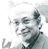
洋画家 絹谷 幸二 (きぬたに こうじ)

奈良市生まれ。東京藝術大学絵画科油画卒業、同大学院を修了後のイタリア留学で古典技法アフレスコを習得。その技法を独自のものとしながら、画家自身にたぎるエネルギーを表出したかのような奔放かつ鮮烈な絵画表現。人物画でスタートしたその画業は、ヴェネツィア風景、富嶽などの多様な展開を見せながら、近年は古事記をはじめ日本の神話、信仰を背景とするドメスティックな精神世界を追求するなど、さらなる円熟の境地に達している。1997年、長野冬季五輪の公式ポスターを手掛ける。文化功労者、日本芸術院会員、独立美術協会会員、東京藝術大学名誉教授、大阪芸術大学教授。