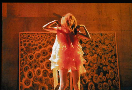
2012年9月14、15、16日 Scar Tissue III ～再生するための冷たい掌～ @中野テルプシコール

今回こちらのwebサイトにてクラウドファンディングに参加させて頂きました。皆様ご支援、宜しくお願い致します。