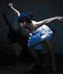
2012年4月30、5月1、2日 Scar Tissue @pit 北区

《ご予約 / お問い合わせ》 minamiazu.dance@gmail.com