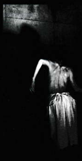
2012年11月3日 Scar Tissue II ～今ここにある絶望を受け入れる勇気～ @中野テルプシコール