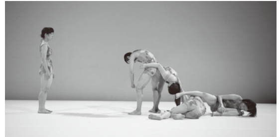
『Miroedetut / ミロエデトゥット』(2014)より

関かおりが中心になって創作、振付を行うカンパニー。2013年設立。PUNCTUMUN (プンクトゥムン) は、ラテン語のPunctum「小さな点、点紋、刺し傷」とフランス語のun「1つの」からの造語。1つの中に小さな無数の点があつまることを意味する。