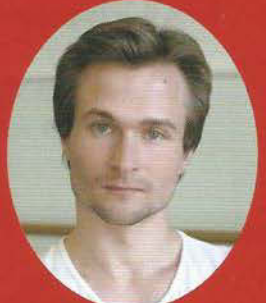
パーベル・ビノグラードフ Pavel Vinogradov