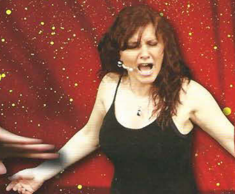
歌手&ダンス クラウディア・モントーージャ