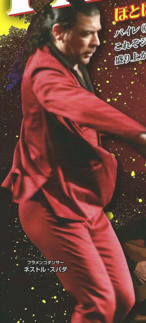
フラメンコダンサー ネストル・スバダ

ほとばしる情熱と魂を揺さぶる熱きメッセージ! バイレ(踊り)・カンテ(歌)・トケ(ギター)・パルマ(手拍子)・ハレオ(掛け声) これぞジプシー達の心の叫び! 実力の熱き舞踊は必見!! 盛り上がり必至の魅力溢れるフラメンコ!!