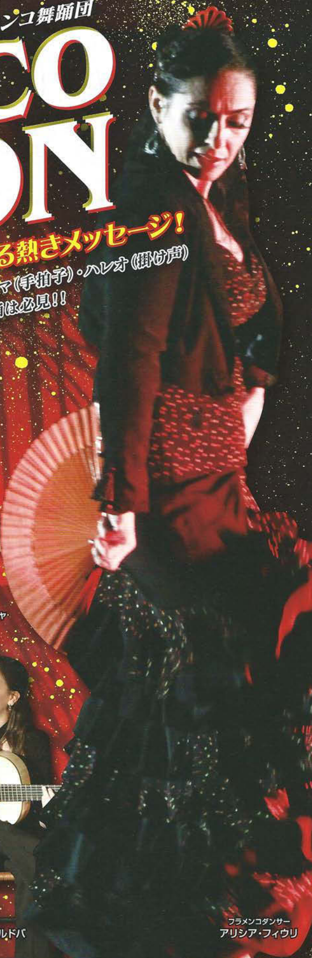
フラメンコダンサー アリシア・フィウリ