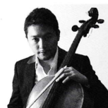
古川展生(チェロ) | Nobuo Furukawa (Cello)

14歳で牧阿佐美バレエ団公演でキュービット役に抜擢され一躍注目を浴びる。18歳主役デビュー以後主役を務める。開館と同時に新国立バレエ団に移籍。柿落としより主役を務める。クラシック・バレエを中心に活動しているがコンテンポラリー・ダンスやミュージカルにも積極的に挑戦、新境地を拓く。進歩し続ける技術・表現力、品格ある舞台で観客を魅了する日本を代表するバレエダンサーの一人。2013年、島地保武とのユニットAltneu(アルトノイ)を発足。活躍の場を広げる。現在、新国立劇場バレエ団名誉ダンサーとして登録。村松賞新人賞、舞踊評論家協会新人賞、中川鋭之助賞、芸術選奨文部大臣賞新人賞、服部智恵子賞のほか、09年には芸術選奨文部科学大臣賞を受賞するなど受賞歴多数。