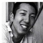
小尻健太 | Kenta Kojiri

桐朋学園大学卒業。チェロを故・井上頼豊、秋津智承、林峰男らに師事。ハンガリー国立リスト音楽院に留学。1997年第27回マルクノイキルヘン国際コンクール(ドイツ)チェロ部門にてディプロマ賞受賞。98年帰国後、東京都交響楽団首席チェロ奏者に就任、現在に至る。2003年第2回齋藤秀雄メモリアル基金受賞。国内外の多数のオーケストラ、著名指揮者と共演を重ね、各地でソロリサイタル、室内楽の活動も精力的に展開。また、他ジャンルのアーティストとのコラボレーションも積極的に行い、映画『おくりびと』のテーマ曲のソロ演奏を担当するなど、人気、実力ともに注目を集める。09年、藤原道山(尺八)、妹尾武(Pf.)とユニット「KOBUDO-古武道-」を結成。新たな音楽の創造を目指す演奏活動を展開。