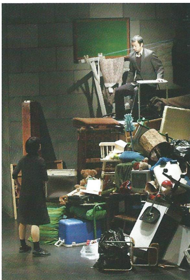
2008年「ある女の家」初演時舞台より

空間を自在に操るようなスピーディで刺激的な演出・振付に「セリフ」が加わり、しかも目を離すことのできない魅力的な世界が次々と展開していきます。どうぞご期待ください!