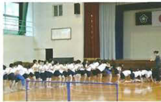
2013年アウトリーチ風景

国内外で活躍するアーティストが学校や福祉施設などに出向き、さまざまな人たちがダンスや演劇でふれあうプログラムを行います。アーティストが持つ多様な価値観に出会うことで、地域に暮らす人々の想像力と創造性を高め、豊かな地域作りを目指します。