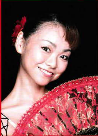
上野水香 Mizuka Ueno

2004年東京バレエ団に移籍入団。直後より「ドン・キホーテ」「ボレロ」など大役を射止め、以後も「白鳥の湖」「ジゼル」「ラ・バヤデル」などに主演。長身に柔軟な身体を生かした華麗な踊りとコケティッシュな魅力でスターのオーラを放つ。「ドン・キホーテ」キトリ役は当たり役の一つ。