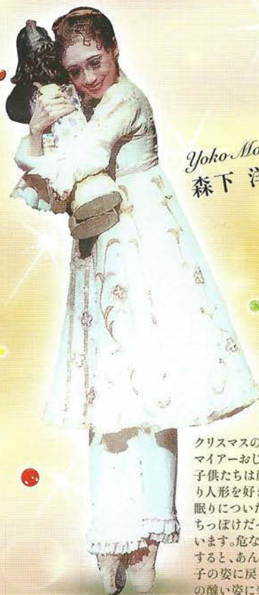
Yoko Morishita 森下 洋子