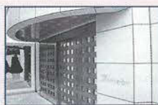
都内・近郊に教室有り。詳しくは本校までお問い合わせ下さい。

国分寺校 ..... 国分寺市本町4-12-4 司アートシティB1F 番町・魏町校 ..... 千代田区六番町1-15 六番町プレイス1F