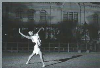
Noism2 x プロジェクションマッピング『Painted Ghosts』(2014)