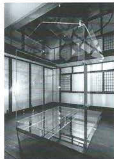
2013 ギャラリーナカムラ「透家」

1961年高知県生まれ。1987年に東京芸術大学大学院美術研究科油画を修了。2011年ART CROSSING NIIGATA2011 うちのDEアート、2013年ギャラリーナカムラ「透家」（個展）など国内外で精力的に活動。近年、アートをとおして人と街に関わる活動やワークショップなどに積極的に取り組む。