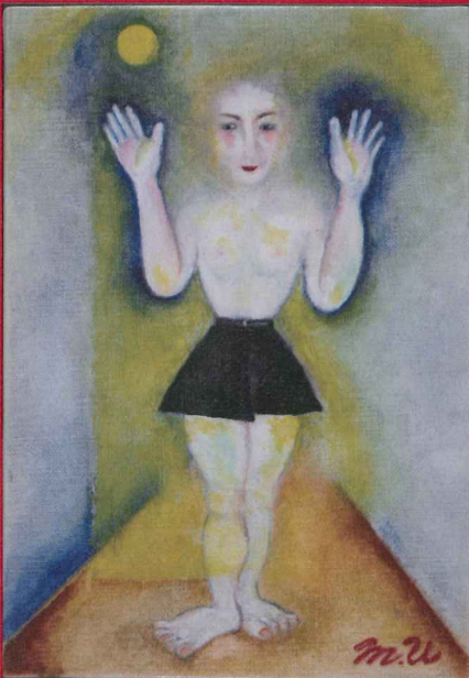
《メランコリア》(2014年/油彩・カンバス/158×228mm)