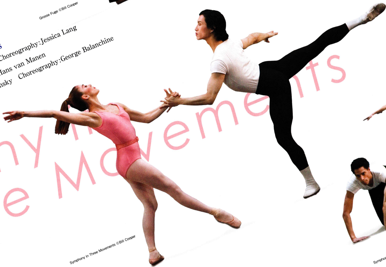
Symphony in Three Movements