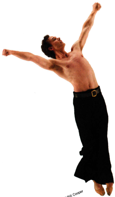
Grosse Fuge