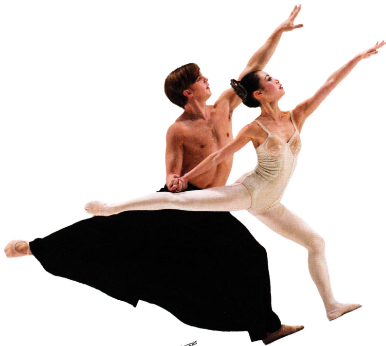
Grosse Fuge