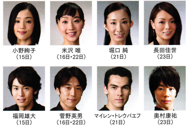
ステージ写真撮影:瀬戸秀美