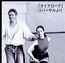
「ダイアローグ」リハーサルより