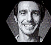
ホアキン・ デルルス Joaquin De Luz