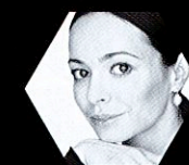
ディアナ・ ヴィシニョーフ Diana Vishneva