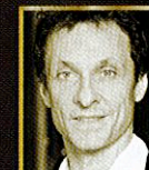
マニエル・ルグリ Manuel Legris

貴公子ルグリが 選りすぐりの 仲間たちと共に贈る、 新しい、夢のような、 バレエの瞬間!