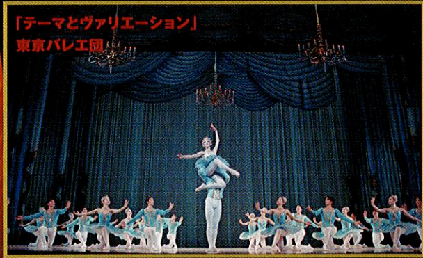
「テーマとヴァリエーション」 東京バレエ団