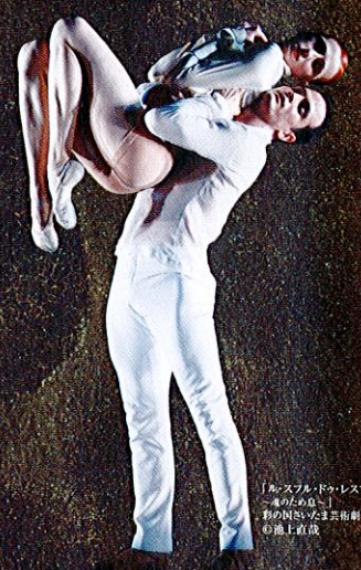
「ル・スフォル・ドゥ・レスプリ 〜愛のためは〜」 秋の国営バレエ団公演より