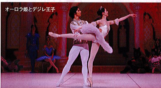
オーロラ姫とデジレ王子