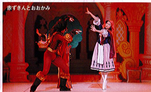
赤ずきんとおおかみ

第2幕 100年がすぎ、リラはデジレという名の王子にオーロラ姫のまぼろしを見せます。姫の美しさに夢中になった王子は、リラの精にみちびかれて森へ行き、姫にくちづけをします。すると姫が、そしてお城のすべてが目覚めました。