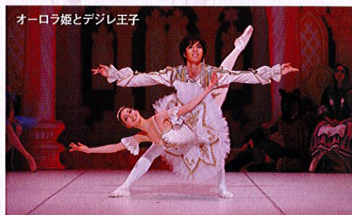
オーロラ姫とデジレ王子

姫と王子の結婚式が行なわれることになりました。きらきら光る宝石の精たち。幸せの青い鳥とフロリナ女王。赤ずきんとおおかみ。シンデレラと王子。しらゆき姫…。童話の主人公たちがお祝いにかけつけ、さいごはオーロラ姫とデジレ王子のすばらしい踊りがひろうされて、人々はしあわせな二人をたたえました。