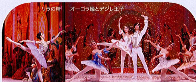
リラの精 オーロラ姫とデジレ王子

姫と王子の結婚式が行なわれることになりました。幸せの青い鳥とフロリナ王女、赤ずきんとおおかみ、シンデレラと王子、白雪姫…。童話の主人公たちがお祝いにかけつけ、さいごはオーロラ姫とデジレ王子のすばらしい踊りがひろうされて、人々はしあわせな二人をたたえました。