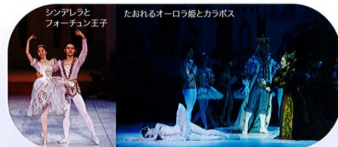
シンデレラとフォーチュン王子

ある国の王さまと王妃さまに、オーロラという名の美しいお姫さまが生まれました。お城ではお祝いのパーティが開かれ、おおぜいのお客さまや妖精たちが招かれました。けれど、ひとりだけパーティに招かれなかった妖精カラボスが、おこっぺお城にのりこんできました。カラボスは「オーロラ姫は16さいのたんじょうびに針で指を刺して死ぬ」とのろいをかけます。しかしリラの精は「姫は死にません。私が守ってねむらせ、100年後に姫を愛する若者がくちづけすれば、ねむりから覚めるのです」と言いました。