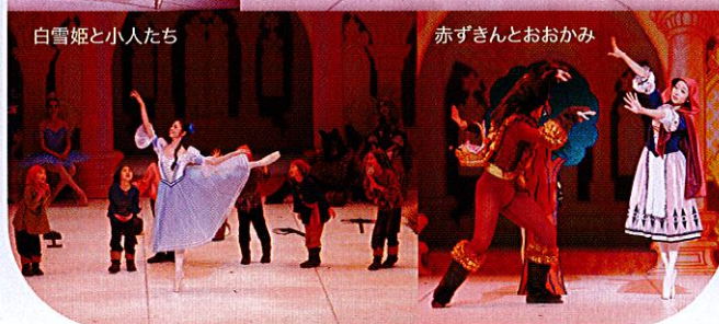
白雪姫と小人たち