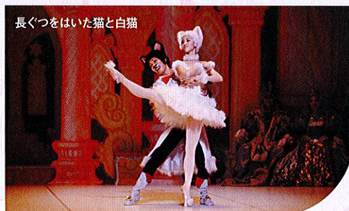
長ぐつをはいた猫と白猫