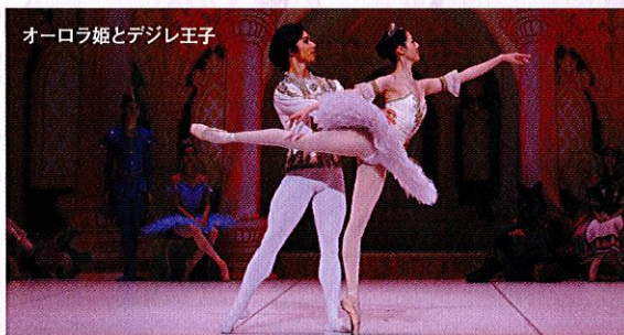
オーロラ姫とデジレ王子

姫と王子の結婚式が行なわれることになりました。きらきら光る宝石の精たち。幸せの青い鳥とフロリナ王女。赤ずきんとおおかみ。シンデレラと王子。しらゆき姫…。童話の主人公たちがお祝いにかけつけ、さいごはオーロラ姫とデジレ王子のすばらしい踊りがひろうされて、人々はしあわせな二人をたたえました。