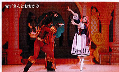
赤ずきんとおおかみ