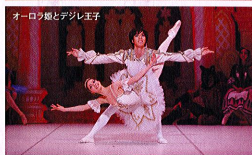
オーロラ姫とデジレ王子

姫と王子の結婚式が行なわれることになりました。きらきら光る宝石の精たち。幸せの青い鳥とフロリナ王女、赤ずきんとおおかみ、シンデレラと王子、しらゆき姫…。童話の主人公たちがお祝いにかけつけ、さいごはオーロラ姫とデジレ王子のすばらしい踊りがひろうされて、人々はしあわせな二人をたたえました。