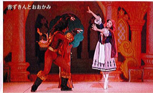
赤ずきんとおおかみ

第2幕 100年がすぎ、リラはデジレという名の王子にオーロラ姫のまぼろしを見せます。姫の美しさに夢中になった王子は、リラの精にみちびかれて森へ行き、姫にくちづけをします。すると姫が、そしてお城のすべてが目覚めました。