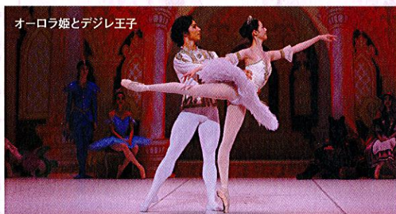
オーロラ姫とデジレ王子