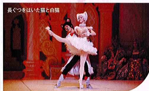
長ぐつをはいた猫と白猫