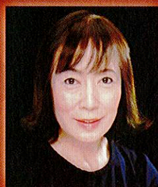
構成・振付: 深沢和子

指揮 ヴォルフガング・ヴェンゲンロート 構成・振付 深沢和子 演出 太田麻衣子 バレエ バレエ団芸術座 特別出演 浅田良和、夏山周久、香野竜寛、沼口賢一 照明・舞台監督 八木清市 装置 東宝舞台 合唱 静岡児童合唱団