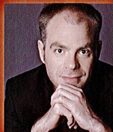
指揮: W.ヴェンゲンロート