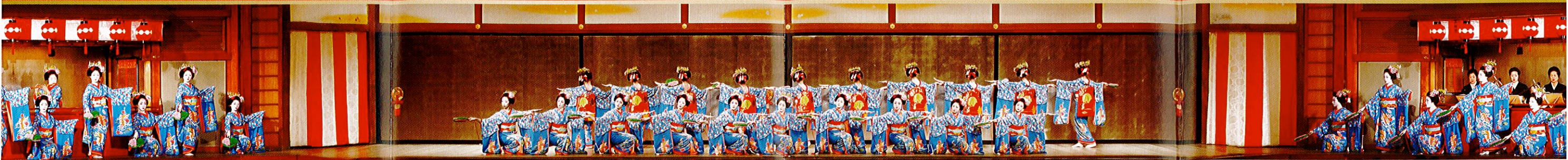
画像は第1景 置歌のイメージです。写真は平成24年都をどりのものです。