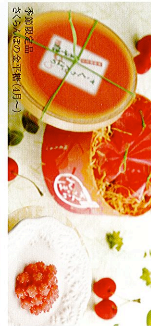
季節限定品 さくらんぼの金平糖(4月~)

熟練の職人が一種類二週間以上かけて手づくりする金平糖は、六十種類以上もの数々の逸品を、季節に応じて取り揃えております。