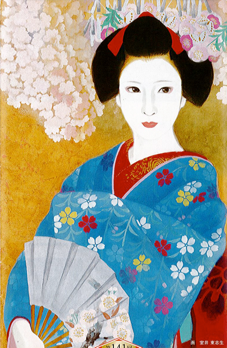
第141回 画 室井 東志生