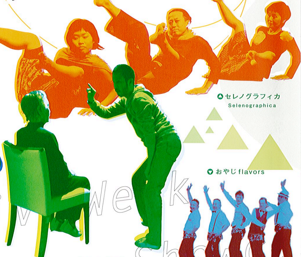
セレノグラフィカ Selenographica