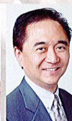
黒岩祐治 神奈川県知事