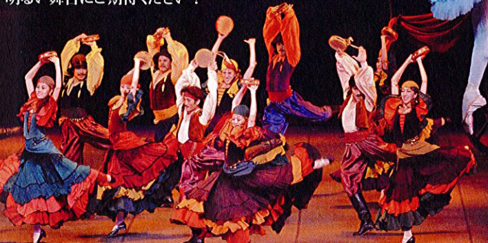
美術: ヴャチェスラフ・オークネフ Designs: Vyacheslav Okunev 照明: 梶 孝三 Lighting: Kaji Kozo