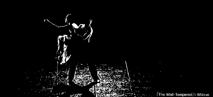
「The Well-Tempered」

社会の中で個人の純粋を保とうとしたとき、人はどのようにその矛盾に向かい合うのか。昨年「Shakespeare THE SONNETS」で多くの称賛を得た中村恩恵2008年の作品。