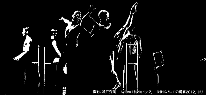
Noism 1 solo for 2 | NHKテレビの観覧2012より

2009年にNoismによって発表された作品の改訂版。Noismバレエの技法を用いて〈2の為の1〉をコンセプトに創作され、〈NIHKバレエの饗宴〉で日本バレエ界に衝撃を与えた作品。