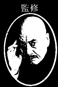
磨 赤 兒

* 開 場 は 開 演 の 30 分 前 より / 開 演 1 時 間 前 より 入 場 整 理 券 発 行 * 当 口 券 は 発 行 さ れ ない 場 合 が あ り ます 。 * ス ペ ー ス の 都 合 上 、 お 荷 物 は お 預 かり いた し ます の で ご 了 承 く だ さ い 。