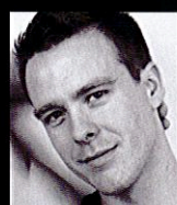
ジョン・ヘンリー・リード