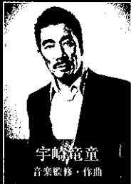
宇崎竜童 音楽監修・作曲