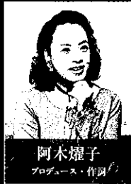
阿木燿子 プロデュース・作詞