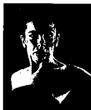
バイレ(踊り) イサベルバジョン (フラメンコ舞踊家・振付家)

公式サイト http://www.marilacampanilla.com/jpn/index.html