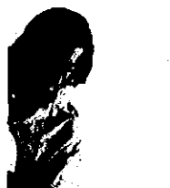
トケ(ギター): ヘストレス