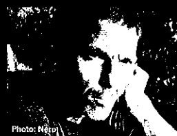
オハッド・ナハリン Ohad Naharin