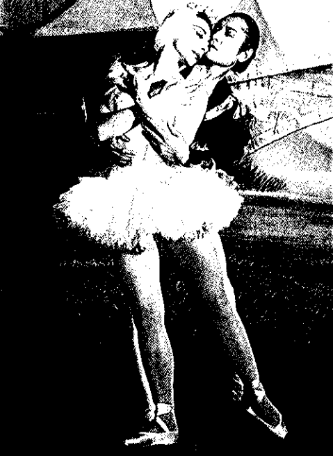
1953年 ノラ・ケイ アメリカンバレエシアターより客演 日劇東宝主催