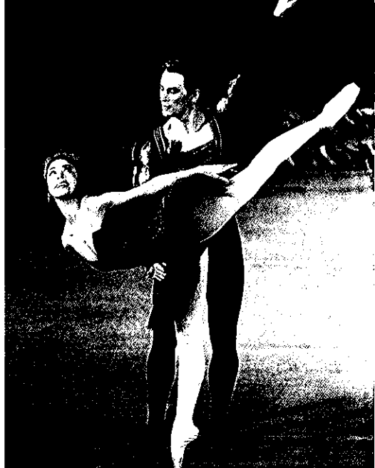
1959年 マーゴット・フォンテイン マイケル・サムス 英国ロイヤルバレエより招聘 皇太子ご婚約記念公演 宮内庁・外務省助成